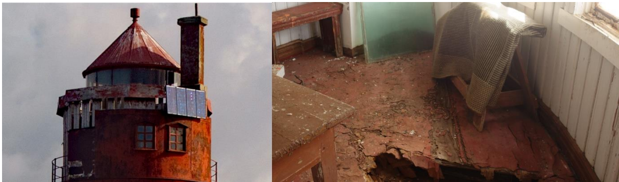
Kya fyrstasjon i Trøndelag fyller hundre år i 2020. Fyret er fredet, men blir ikke vedlikeholdt.

Kystverkets egen dokumentasjon, f.eks. fra Kya fyr i Trøndelag, viser at noen av disse fyrstasjonene ikke vedlikeholdes godt nok.