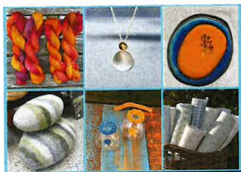
Salgsutstilling på Tungenes Fyr