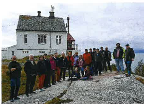
Seminar deltagerne i Lødingen besøkte Barøy fyr

Det har i samarbeid med Kystverkmusea, vært arrangert to regionale fyrhistoriske seminar i 2022. Det ene var lagt til Måløy og Kinn kommune i forlengelsen av landsmøtet, mens det andre var lagt til Lødingen i Nordland i september. Begge seminarene var godt besøkt.