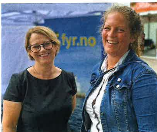
Tidligere Stortingspresident Tone Wilhelmsen Trøen og styreleder