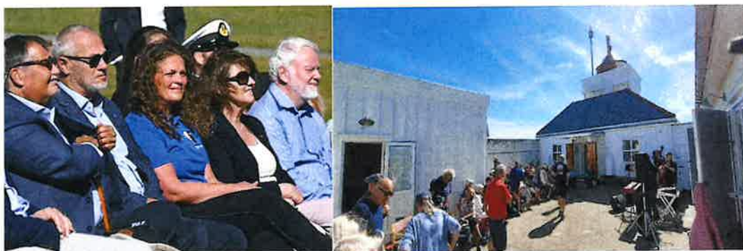
Norsk Fyrforening markerte sitt 25 års jubileum i Stavern og på fyrene Svenner, Stavernsodden og Tvistein (bildet til høyre).

Markeringen av Norsk Fyrforenings 25 års jubileum var den viktigste aktiviteten i 2022. Markeringen var lagt til Stavern og foreningen samarbeidet nært med de lokale kystlagene og drivergruppene ved Svenner fyr, Stavernsodden fyr og Tvistein fyr. Markeringen foregikk over tre dager i august og besto av konserter, foredrag, kunstutstillinger og fyrbesøk.