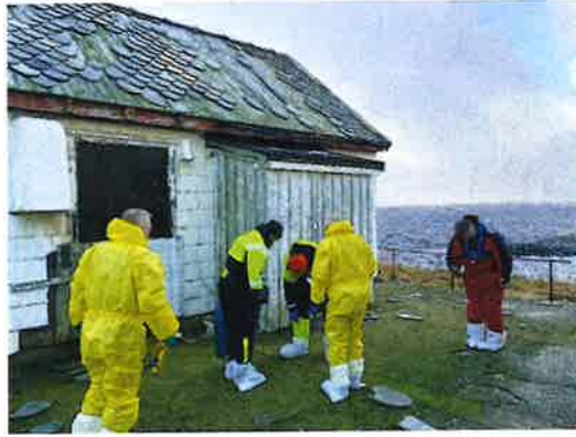
Befaring på Skalmen fyr

Gjennom tilstedeværelse på flere arrangement så har foreningen kommet i god kontakt med publikum som har fattet interesse for fyr og frysaken. Publikumskontakt gir gode tilbakemeldinger og har resultert i økt medlemsmasse.