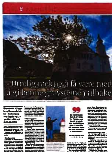
Agder (Flekkefjord Tidende)