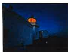
30. juli 2025

Ved flere av de fredede fyrstasjonene er forfallet kommet så langt at fyrstasjoner står i fare for å «falle tilbake til naturen». Det er derfor gledelig at Kystverket i 2025 fikk tildelt ekstra ressurser slik at en rekke nye rehabiliteringsprosjekter ble igangsatt. Kystverket må få tilført ressurser fra Storting og regjering for å kunne redusere etterslepet på fyrstasjonene.