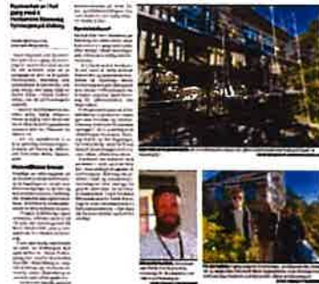
Kragerø Blad - Vestmar