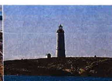
Lille Torungen fyr