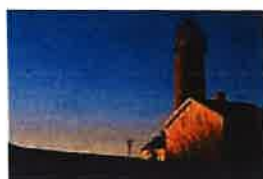
Befaring Lista Fyrstasjon 10. januar 2025