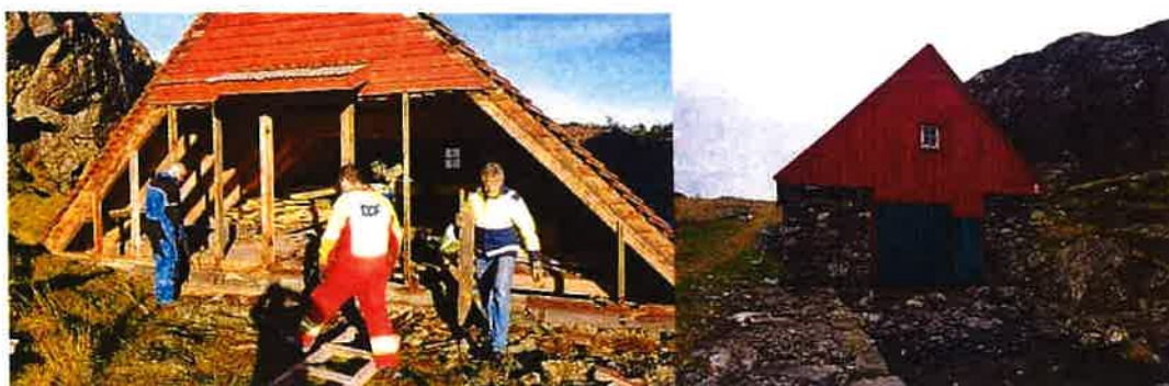
Restaureringen av båthuset ved Skjellanger fyr ble fullført i 2025 takket være midler fra Sparebankstiftelsen DNB og Norsk Fyrforening