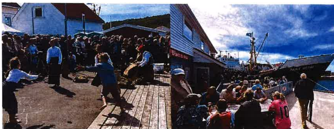
Folk sto som «sild i tønne» under jubileumsarrangementet i Korshavn. Kystverkmuseas M/S «Gamle Okseøy» måtte sette opp en ekstratur for at alle skulle få anledning til å se ilden fra fyrgrøten på Markøy fyr.