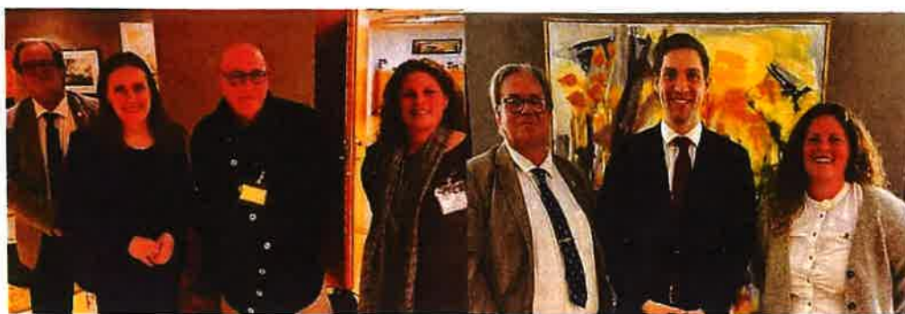
Norsk Fyrforening har hatt møter med statsrådene i Nærings- og fiskeridepartementet og Klima- og miljødepartementet.

På fylkeskommunalt- og kommunenivå har det også vært flere møter.