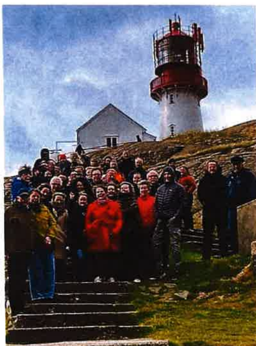
Fyrforvaltere samlet på Lindesnes Fyr under Kystverkets leietagersamling i oktober.

Norsk Fyrforening og 81 fyrforvaltere fra våre medlemsfyr langs hele Riksvei 1, deltok på Kystverkets leietagersamling på Lindesnes og i Kristiansand. Hvert annet år inviterer Kystverket fyrforvalterne ved fyrstasjonene etaten forvalter på vegne av Staten til en tredagers samling.